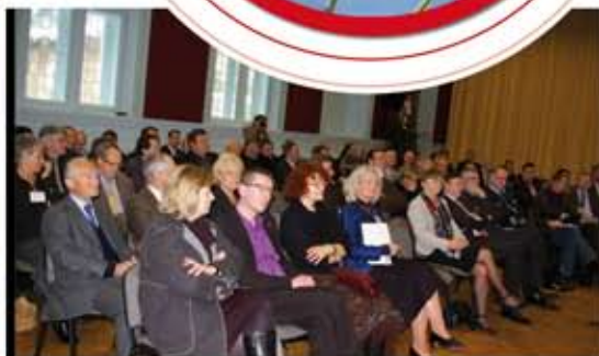
La CCI est favorable à une communauté d'agglomération et l'a répété lors de sa cérémonie des vœux.