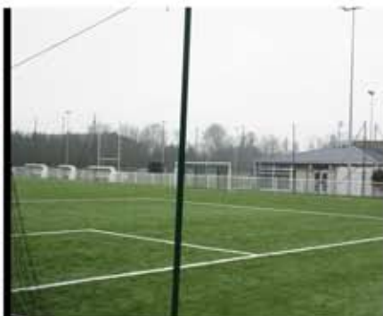
Le stade Auguste-Damette possède un nouveau terrain synthétique.