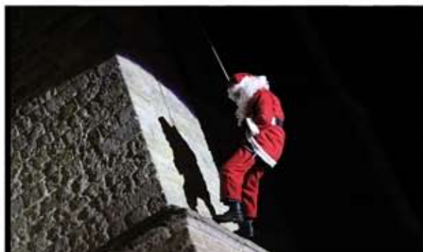
Le père Noël est descendu du clocher de Saint-Eloi pour distribuer des friandises.