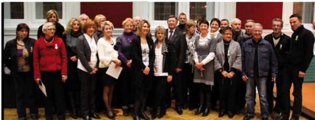
La promotion 2010 des médaillés du travail et des retraités de la Ville.