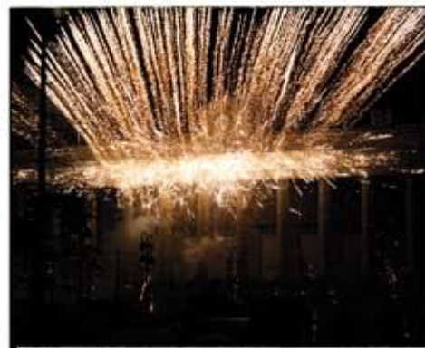
L'hôtel de ville s'est embrasé lors du feu d'artifice de fin d'année.