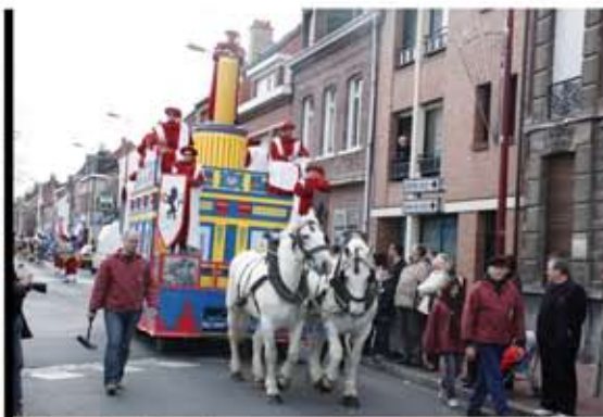
Le cortège historique a connu un nouveau succès populaire.