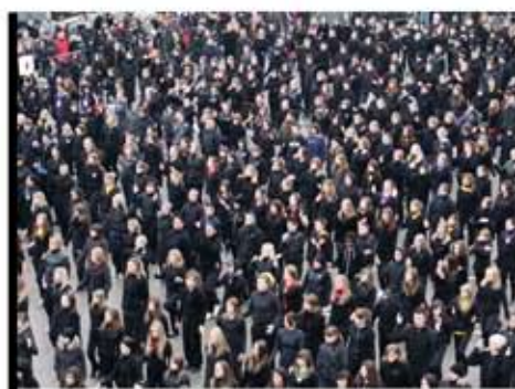
Une Flash Mob gigantesque a marqué les festivités de fin d'année.