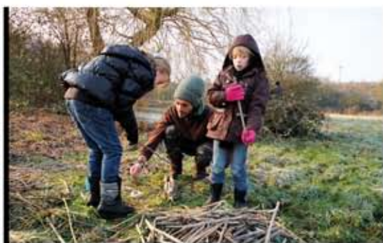
Les chantiers de renaturation ont démarré au Loose Veld et au Sween Pleck.