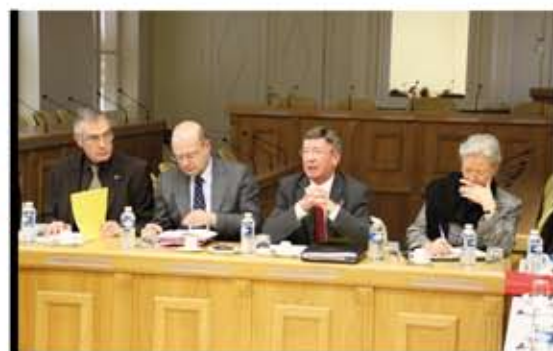
Les réunions de travail se multiplient pour l'abattoir régional.