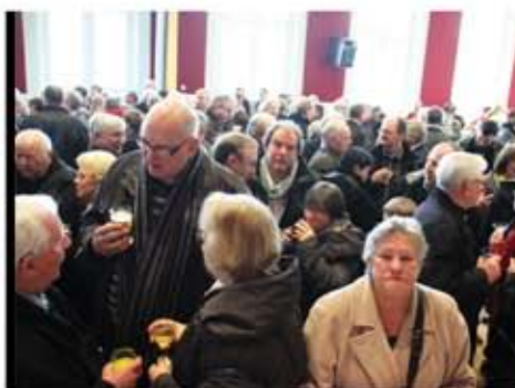
Les vœux à la population ont encore été un succès convivial.