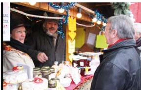
Le marché de Noël sous la neige a agréablement surpris par sa diversité.