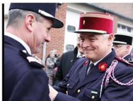
La Sainte-Barbe est l'occasion de mettre à l'honneur nos soldats du feu.