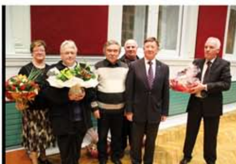
Les retraités 2010 de la Ville ont été mis à l'honneur comme il se doit.