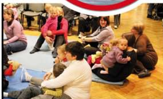
Les tout-petits ont eu droit à leur sapin.